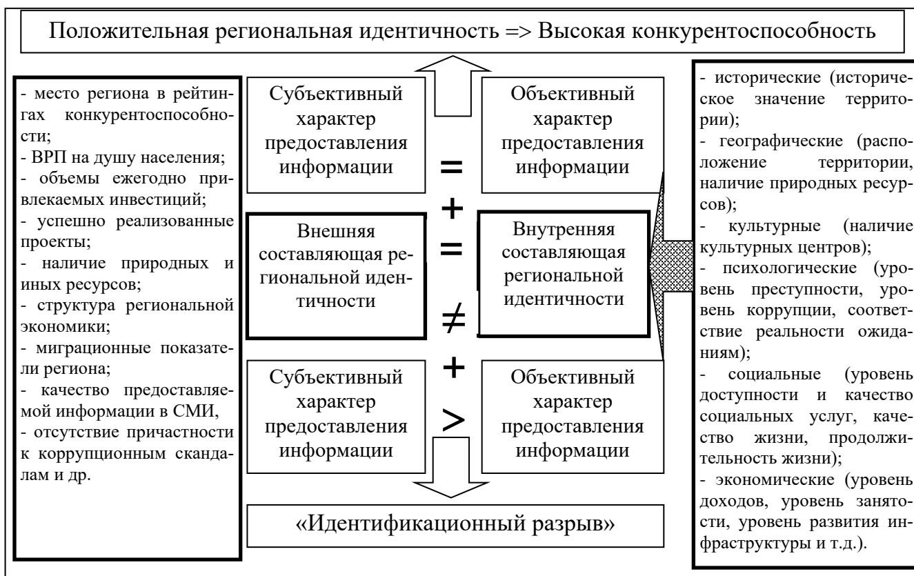
Рисунок 2. Структурная модель региональной идентичности как нематериального фактора развития экономики региона

Структура «региональной идентичности» как нематериального фактора развития экономики региона представлена в виде модели на рисунке 2.