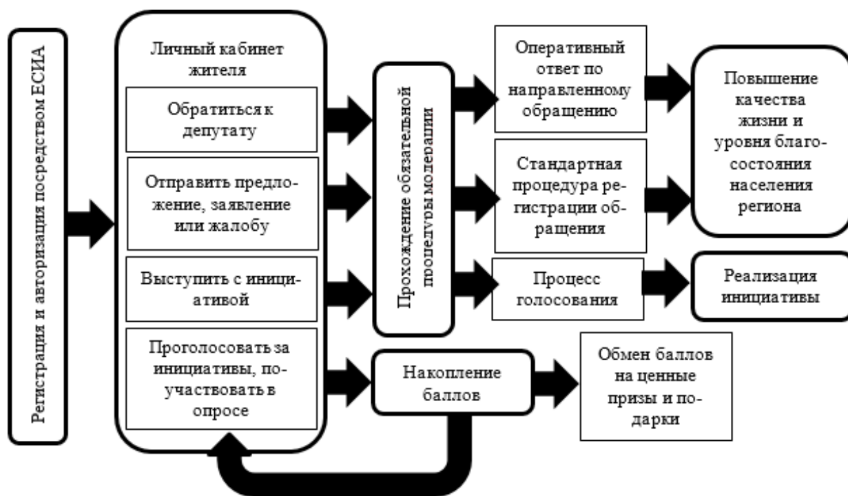
Рисунок 3. Схема функционирования проекта «Наш общий дом»

Для регионов с неэффективным управлением характерно наличие у населения высокой приверженности к своей территории, однако, отмечается недостаток инфраструктурного обеспечения для развития предпринимательской активности и роста показателей экономического развития экономики региона. Проведенный сравнительный контент-анализ реализуемых программ в регионах позволил выявить несколько тенденций, которые необходимо корректировать для наиболее эффективной работы. Во-первых, у предпринимательских структур недостаточно информации о возможных инструментах поддержки предпринимателей. Во-вторых, недостаточное внимание уделяется новостям о политике в муниципальных образованиях. В-третьих, ограничена информация, связанная с деятельностью инфраструктурных объектов региона. При низком уровне информационной поддержки со стороны официальной власти теряется связь между органами государственной власти, хозяйствующими субъектами и населением региона.