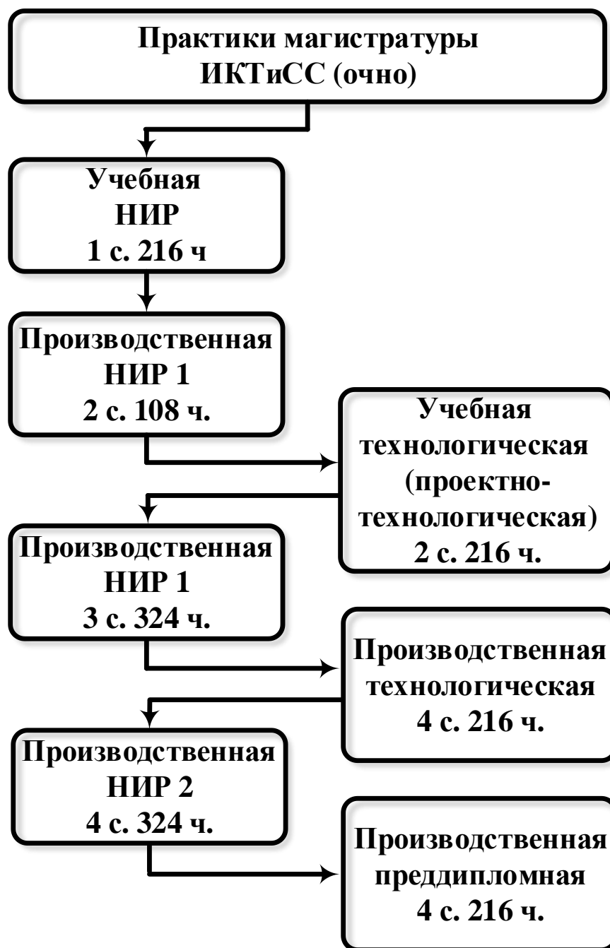
Рис. 1.1. Общая структура практик магистратуры по направлению подготовки 11.04.02

В конце первого года обучения студенты проходят стационарную учебную технологическую (проектно-технологическую практику) с отрывом от обучения.