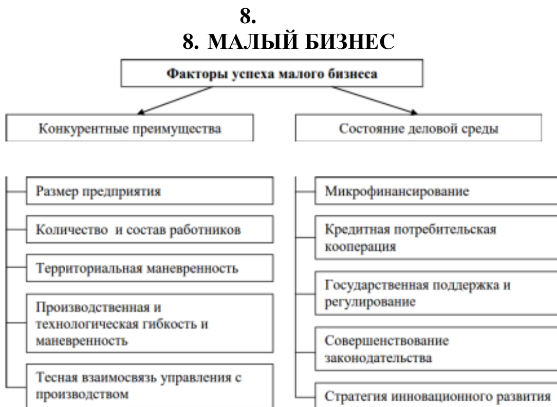
Рис. 1. Факторы успеха малого бизнеса

Организатор игры информирует участников о порядке ее проведения, распределяет роли, выделяет группу экспертов.