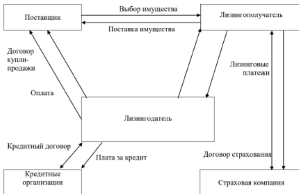
Рис. 1. Общая схема проведения лизинговой операции