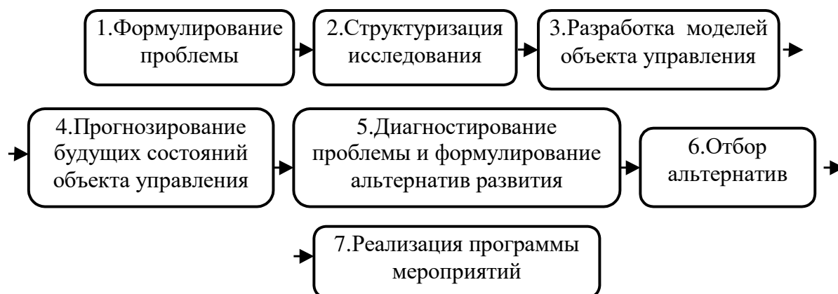
Рисунок 1 - Последовательность этапов системного анализа

Образец оформления рисунка приведен далее.