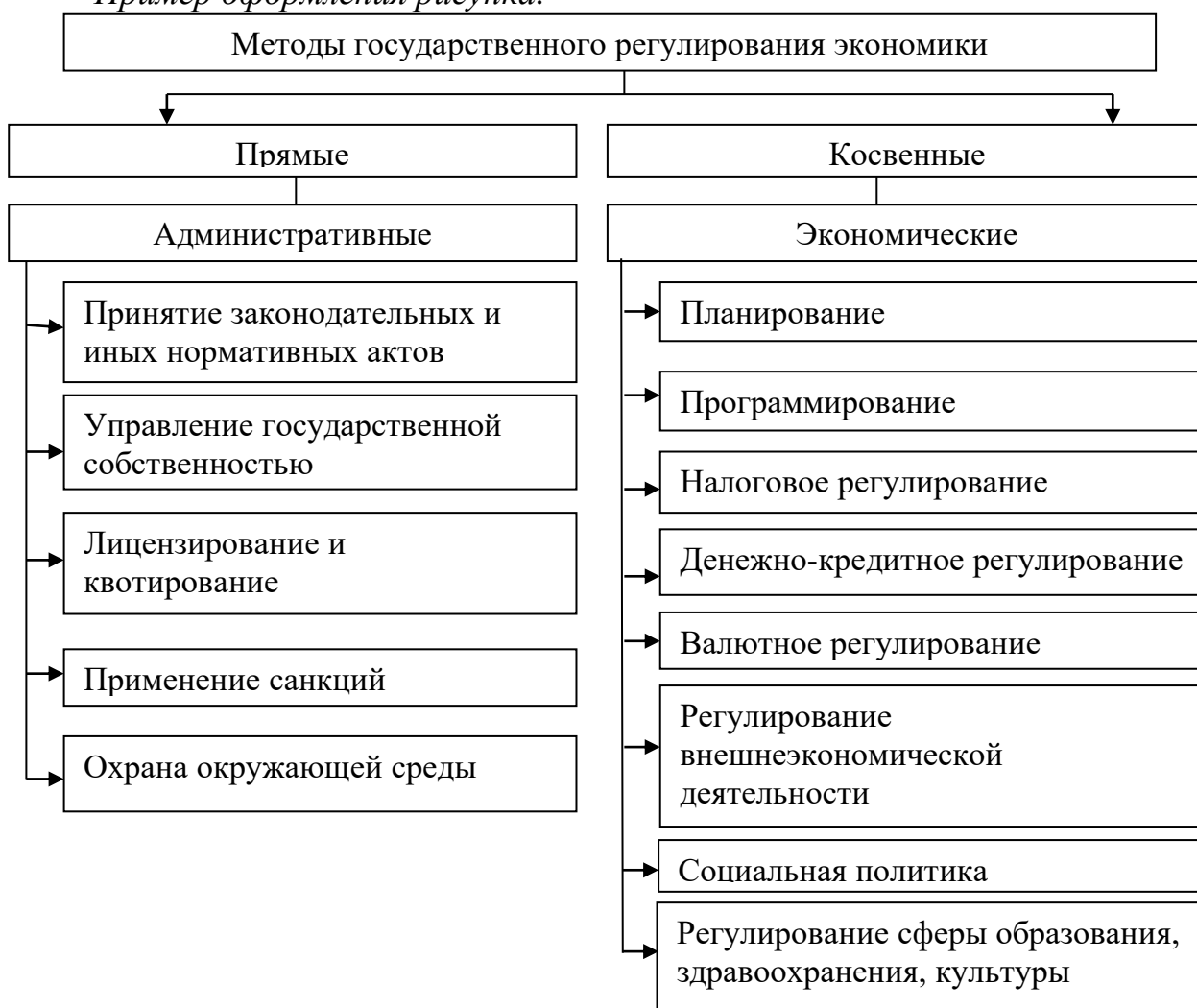
Рисунок 1 – Методы государственного регулирования экономики

Рисунки следует располагать непосредственно сразу после первой ссылки на них по окончании абзаца (без разрыва текста), или на следующей странице, а также в приложениях. Иллюстрации