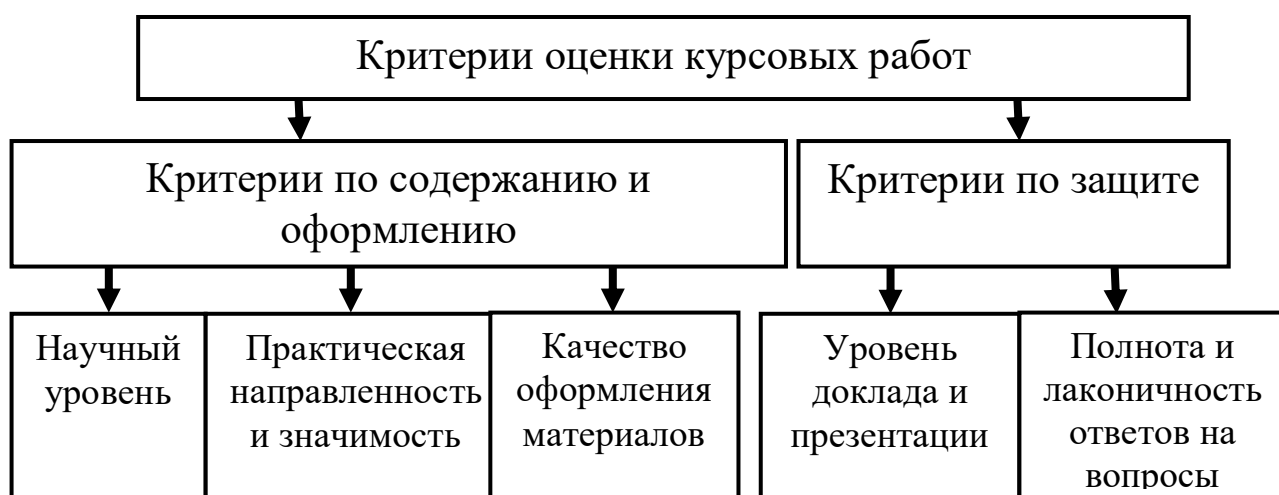
Рисунок 3 – Критерии оценки курсовой работы

Курсовые работы оцениваются в соответствии с разработанными критериями оценки (рисунок 3).