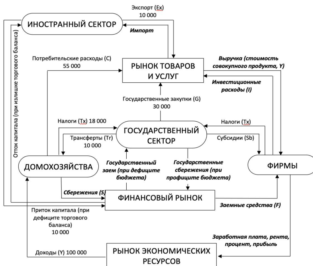
Рис. 1 Схема кругооборота открытой экономики

В схеме кругооборота открытой экономики (рис. 1) рассчитайте недостающие потоки, выделенные жирным курсивом , и проверьте правильность расчетов с помощью основного макроэкономического тождества и тождества «утечек» и «инъекций».