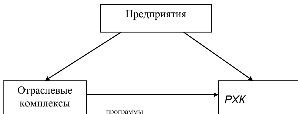
Рисунок 1 - Взаимосвязь между составляющими

Данные статистических наблюдений и их обработка, исходная информация для анализа, горизонтальный и вертикальный анализ, как правило, приводятся в таблицах. Таблица – это перечень сведений, числовых данных, приведенных в определенную систему и разнесенных по графам. Название таблицы должно отражать ее содержание, быть точным и кратким. Слова в названии, в заголовках граф и столбцов таблицы переносить и сокращать нельзя. Номер и название таблицы указываются над таблицей.