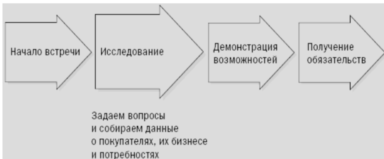
Структура встречи согласно методике СПИН-продажи