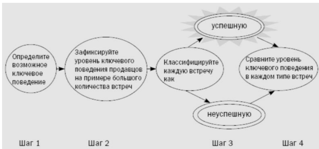
Схема проведения переговоров согласно методике СПИН-продажи