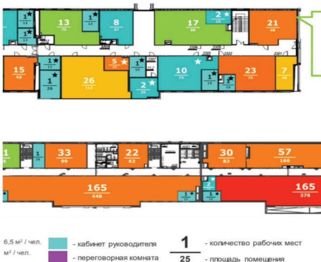
Рисунок 1 – Планировка основного офиса ГК «ВеллМарт»

Численность сотрудников ГК «ВеллМарт» по состоянию на конец сентября 2020 г. составляла 10 000 человек.