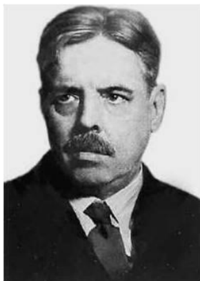
Торндайк Эдуард Ли

Разработка первого педагогического теста принадлежит американскому психологу Эдуарду Ли Торндайку. Он считается основоположником педагогических измерений. Первым педагогическим тестом, вышедшим под его руководством, был тест Стоуна на решение арифметических задач. Именно в США тесты успешности для проверки знаний, навыков и умений обучающихся по отдельным предметам нашли особенно широкое распространение.