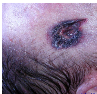
Выстрел в упор из пистолета ПМ