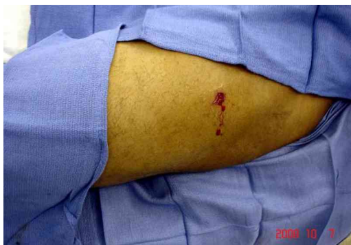
Пулевое ранение бедра

всегда имеется след от пороха или иных взрывчатых веществ в виде небольшого ореола.