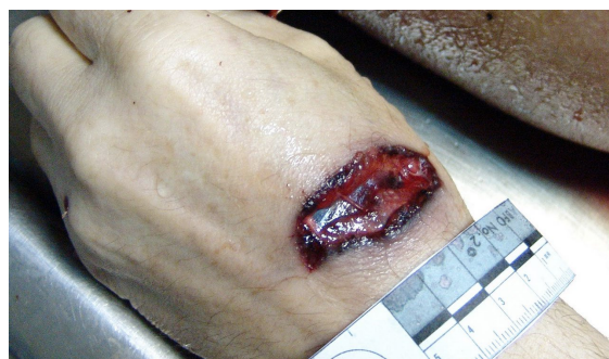
Касательное пулевое ранение из автомата АК-74 Форум судебных медиков [электронный ресурс] http://www.sudmed.ru/index.php?act=Attach&type=post&id=1300