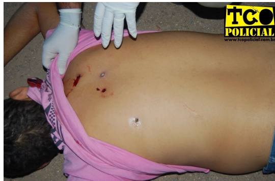
Пулевое ранение в спину