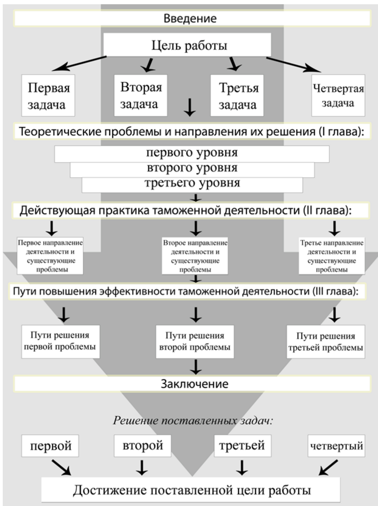
Рисунок 1 – Структурно-логическая схема курсовой работы