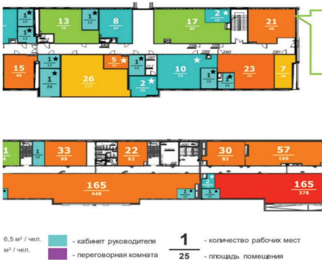
Рисунок 1 – Планировка основного офиса ГК «ВеллМарт»

Численность сотрудников ГК «ВеллМарт» по состоянию на конец сентября 2020 г. составляла 10 000 человек.