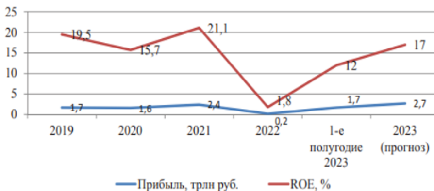
Рисунок 15 – Динамика показателей прибыли и рентабельности банковского сектора РФ с 2019 по 2023 г. [38]

Номер рисунка печатается внизу иллюстрации перед его названием (по ширине через полуторный межстрочный интервал от нижнего края рисунка). Название печатается строчными буквами (первая буква – прописная).