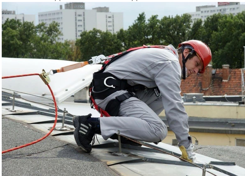
Рис. 13. Удерживающая система

Они состоят из регулируемого или нерегулируемого по длине удерживающего стропа (карабина), анкерного устройства (горизонтальная анкерная линия), страховочной привязи. Удерживающие системы нельзя использовать для остановки падения.