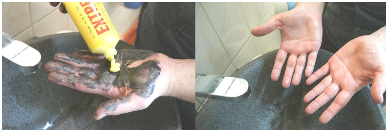
Рис. 14. Нанесение пасты для очистки рук от мазута

нии работы. Как правило, защитные пасты и мази наносят на кожу дважды в течение смены.