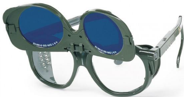
Очки открытые для газосварщика Uvex с двойными линзами