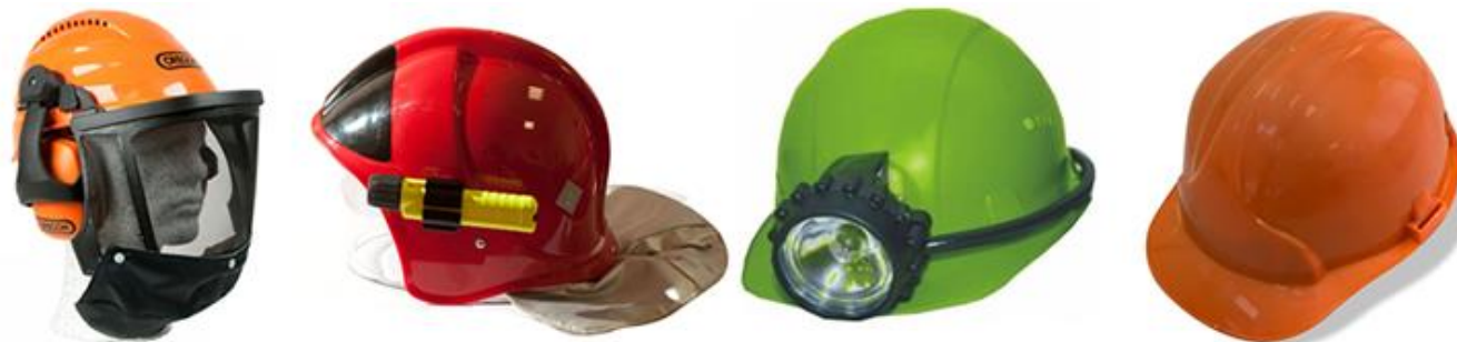
а) каски защитные