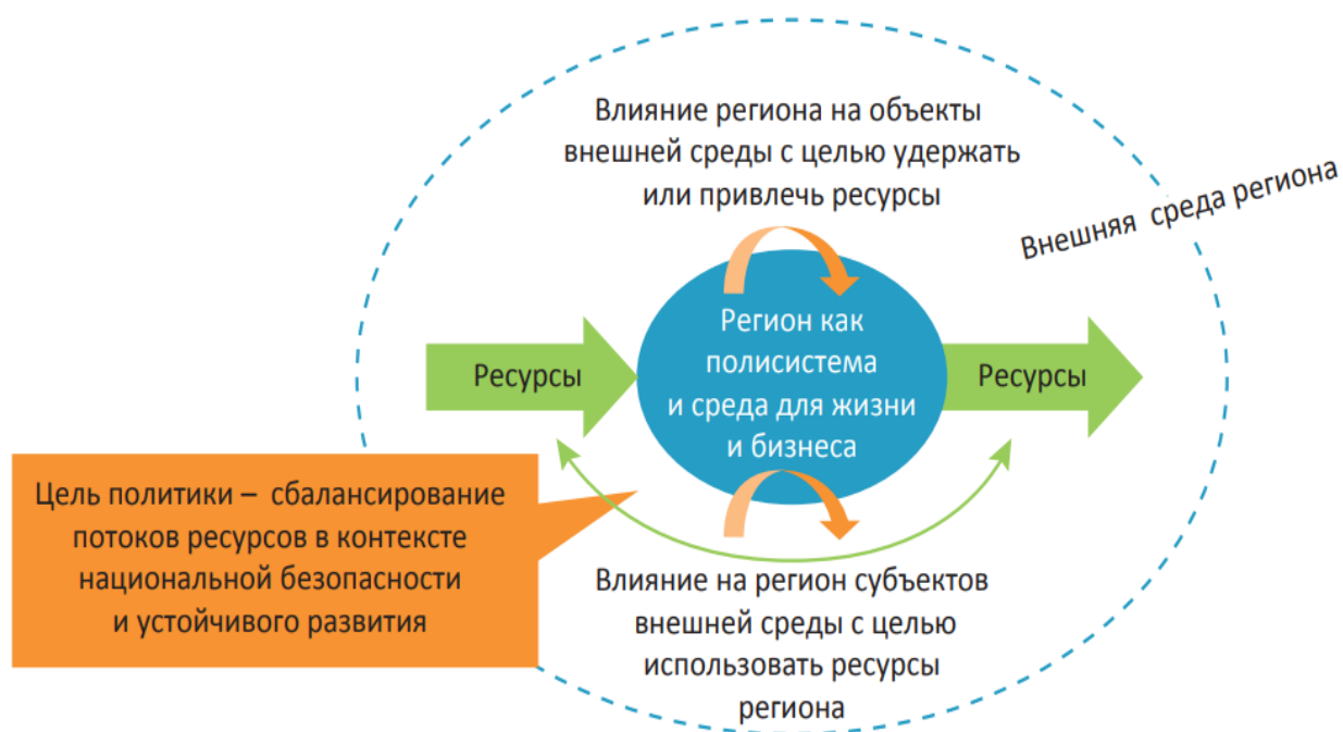
Рисунок 1 – Модель функционирования региона во внешней среде