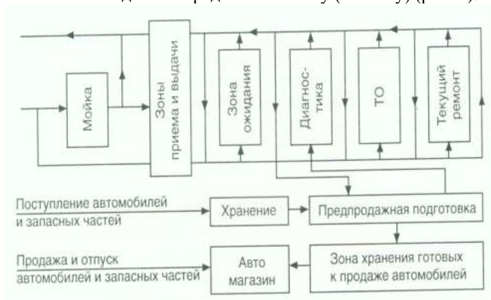
Рис. 4 Схема технологического процесса на СТОА

Рассмотреть технологический процесс обслуживания автомобиля – от его приемки на СТОА до его передачи заказчику (клиенту) (рис. 4).