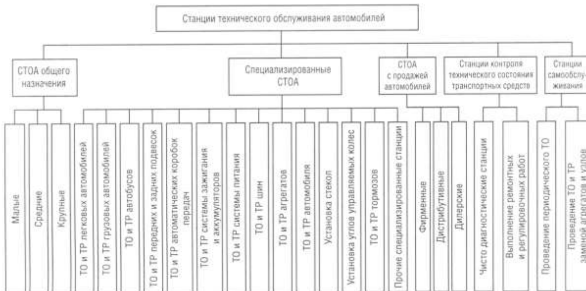
Рис. 3. Классификация СТОА

Определить в зависимости от мощности (расчетного количества комплексно обслуживаемых автомобилей), размера (числа рабочих постов или автомобиле-мест на предприятии), месторасположения, назначения и специализации предприятий виды выполняемых ими работ и их сочетания могут быть различными, что видно из классификации (рис. 3).