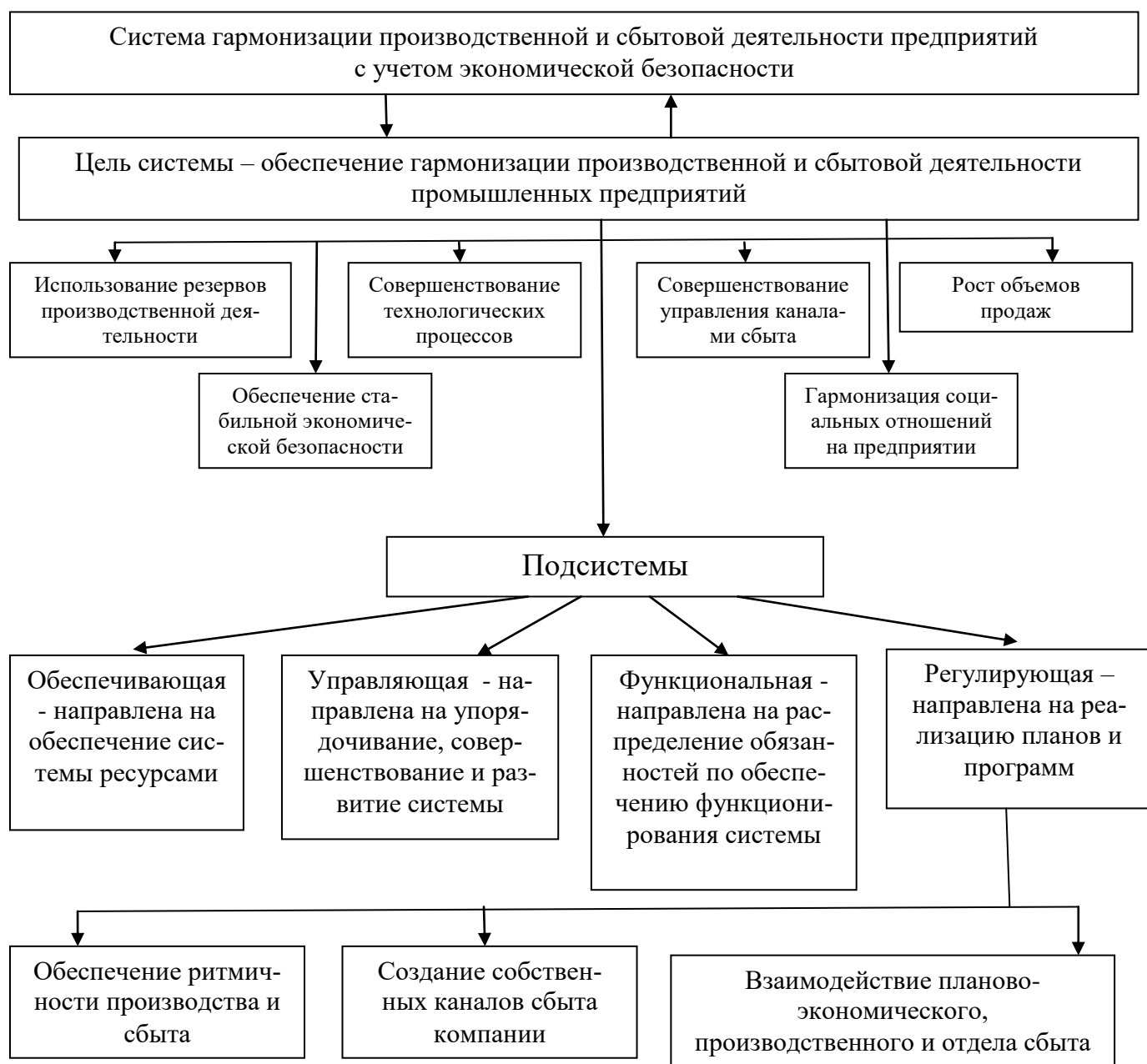
Рисунок 2 – Система гармонизации производственной и сбытовой деятельности предприятия

По результатам комплексного анализа финансово-хозяйственной деятельности промышленного предприятия сделать выводы об эффективности деятельности исследуемого экономического объекта и разработать систему гармонизации производственной и сбытовой деятельности для предприятия (рисунок 2).