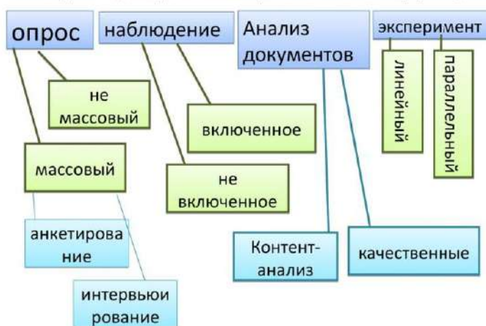
Рисунок 8 – Данные для выполнения задачи