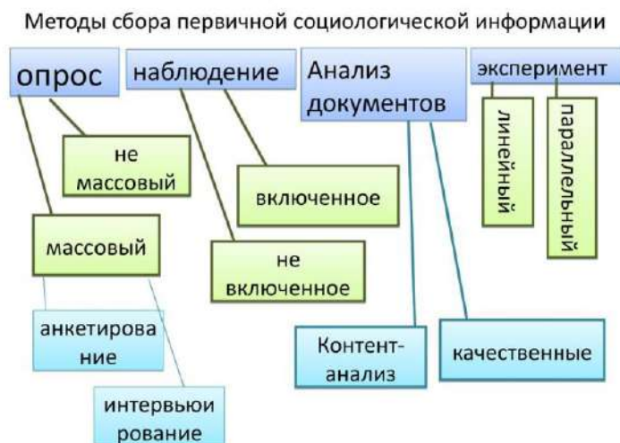
Рисунок 3 – Рисунок для выполнения задачи

2. Можно ли использовать несколько методов сбора первичной информации для одного исследования из приведенных выше примеров?