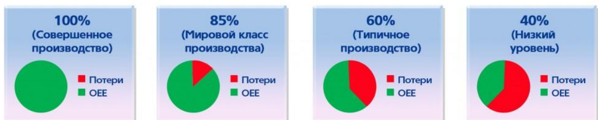
Рис.2 Критерии соответствия ОЕЕ

Совокупный балл всех критериев ОЕЕ, составляющий 40%, является нередким для производственных компаний, которые только начинают отслеживать и повышать эффективность своего производства. Данная оценка является низкой, и в большинстве случаев ее можно улучшить благодаря эффективным мерам, путем отслеживания причин остановок и направления усилий на наиболее крупные источники остановок поочередно