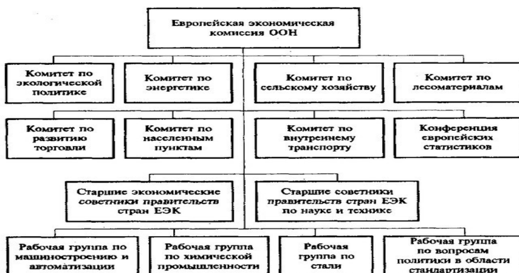
Рисунок 2.1 – Схема организационно – функциональных аспектов деятельности ЕЭК

В ЕЭК ООН имеется семь вспомогательных комитетов и Конференция европейских статистиков: Комитет по экологической политике, Комитет по внутреннему транспорту, Конференция европейских статистиков, Комитет по устойчивой энергетике, Комитет по торговле, Комитет по лесоматериалам, Комитет по жилищному хозяйству и землепользованию и Комитет по экономическому сотрудничеству и интеграции.