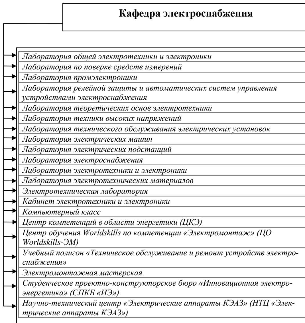
Схема организационной структуры управления кафедры электроснабжения