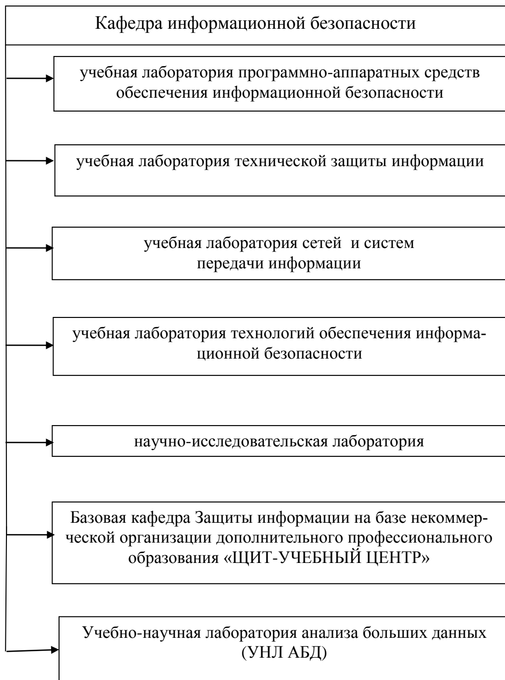
Схема организационной структуры кафедры