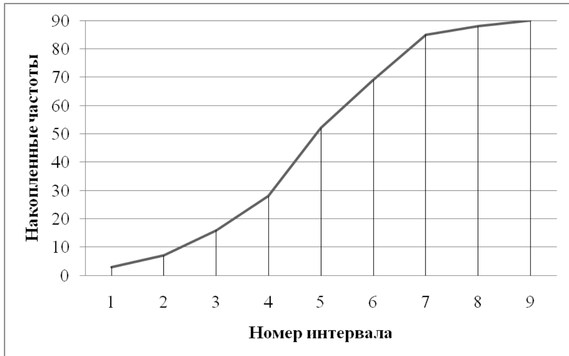
Рис. 2 - Полигон накопленных частот распределения значений диаметра вала