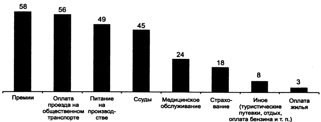
Рисунок - Ответы руководителей гостиниц на вопрос о составе компенсационного пакета.

Был проведен опрос руководителей гостиниц о составе компенсационного пакета. Были получены следующие данные о компенсационном пакете, используемом в гостиничном бизнесе города, в виде следующей диаграммы (рисунок).