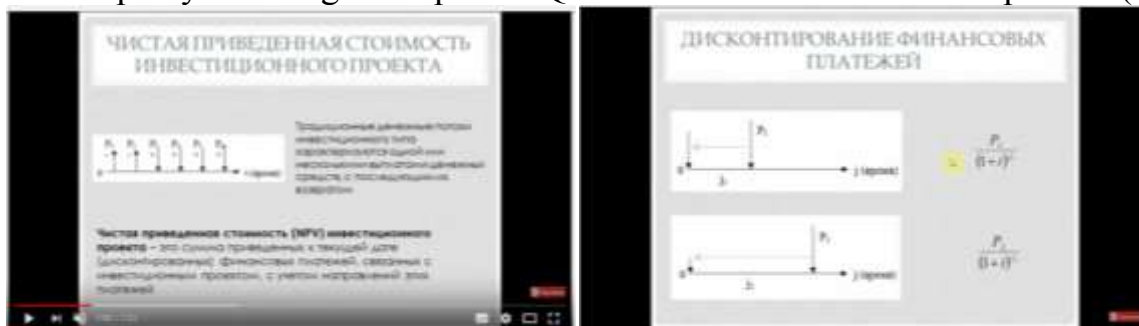
Рис. 1 Расчет стоимости инвестиционного проекта

https://youtu.be/gO4EGpYs1KQ Расчет стоимости инвест.проекта (Рис. 1).