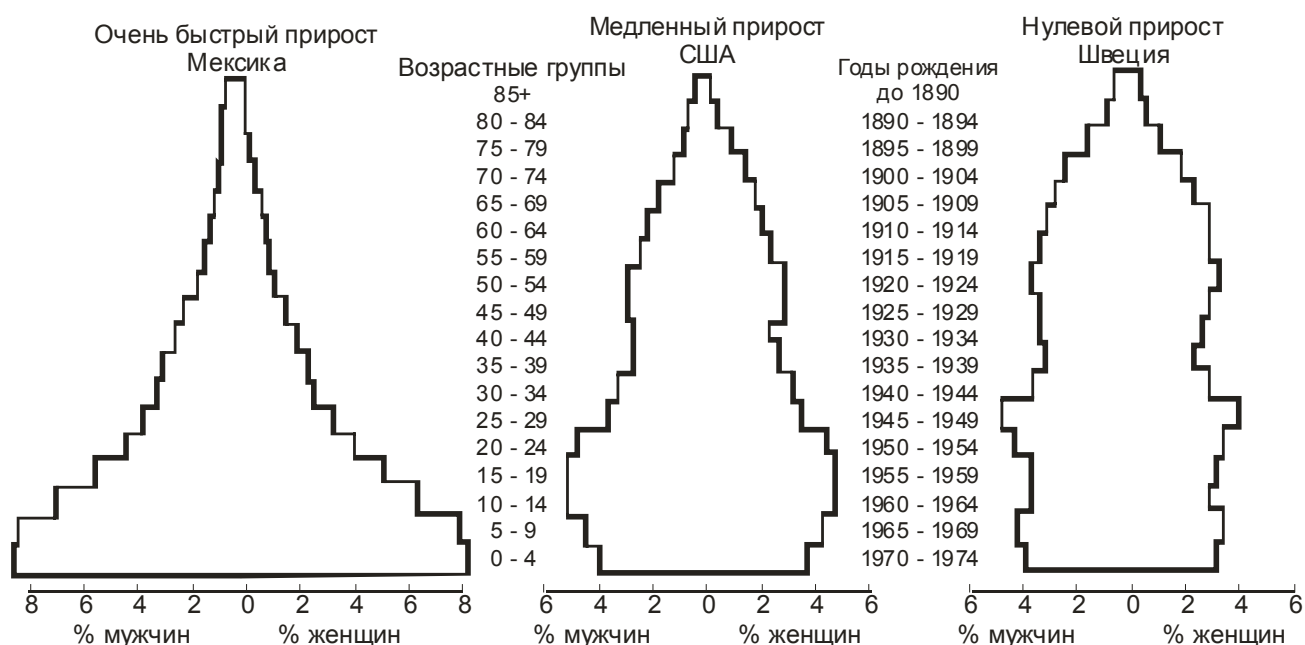
Рис.2. Диаграмма возрастной структуры населения в странах с быстрым, медленным и нулевым приростом. Дорепродуктивный возраст 0 – 14, репродуктивные годы 15 – 44 и пострепродуктивный возраст 45 – 85.

Для исследования возрастной структуры населения пользуются диаграммой возрастной структуры населения, в которой общее число мужчин и женщин распределено по трем возрастным категориям. На рис.2 показаны диаграммы с быстрым, медленным и нулевым приростом населения.