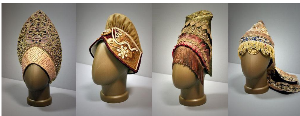
Рис.1 Образцы различных конструкций головных уборов

Четко определенные критерии «хорошей формы» («чисто формы») заменены неопределенным понятием «открытая форма». Эстетика «хорошей формы» теперь признается «устаревшей системой эстетического кодирования отдельных классов». «Хорошая форма», как и «хороший вкус» рассматривается в качестве эстетического символа определенного социального положения и образа жизни, как правило связанных с традициями буржуазной элиты. «Хорошая форма» перестала удовлетворять эстетическим запросам современного человека; достоинство формы теперь видятся не в упорядоченности и организованности, а в образности, обогащающей человека эмоционально. «Новый дизайн» отказывается от «хорошей формы» именно как всеобщего эталона (как и от любых эталонов вообще), но это вовсе не означает, что «хорошая» или «чистая форма» не может составлять основу творческих концепций в современном дизайне. Это доказал триумф минимализма в дизайне 1990-х гг. Но минимализм не трактовался в качестве единственного возможного направления в дизайне, а мирно сосуществовал с такими своими антиподами в дизайне одежды, как деконструктивизм и историзм.