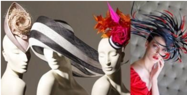
Рис.3 Варианты современных головных уборов