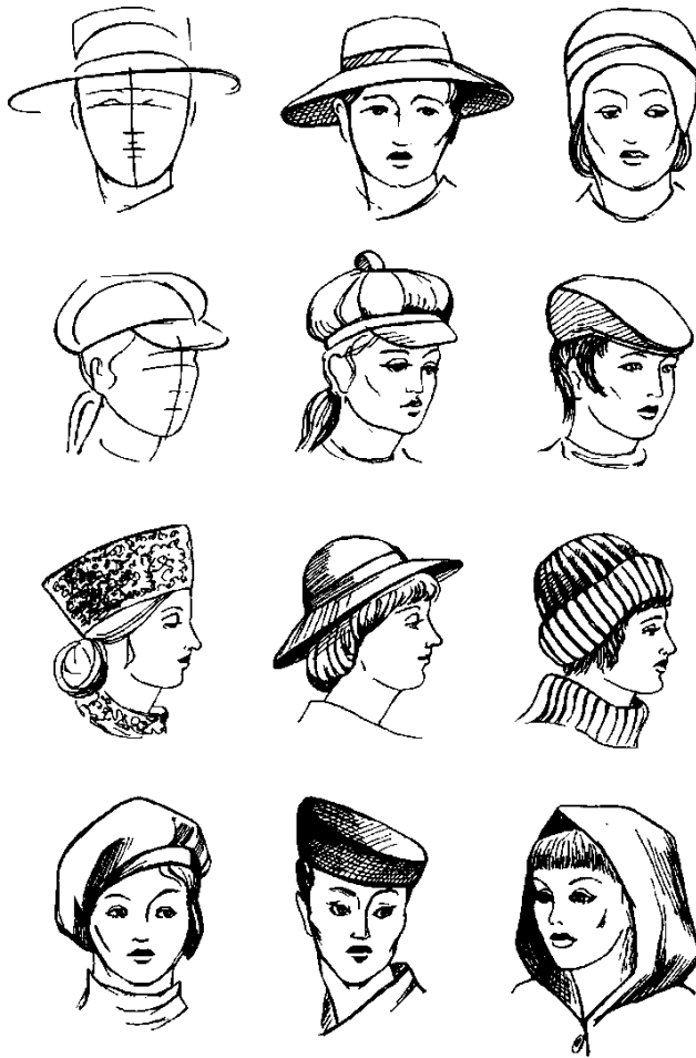
Рис.2 Эскизы головных уборов