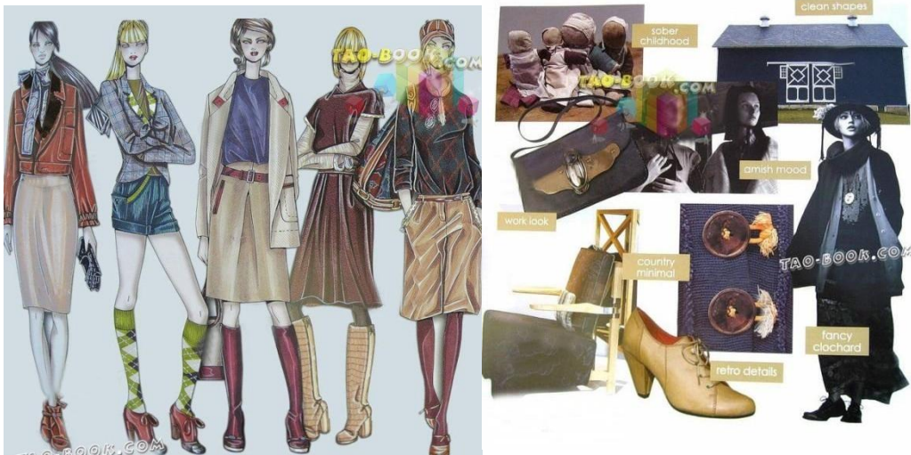
Рис. 9 Роль обуви и аксессуаров в композиции костюма