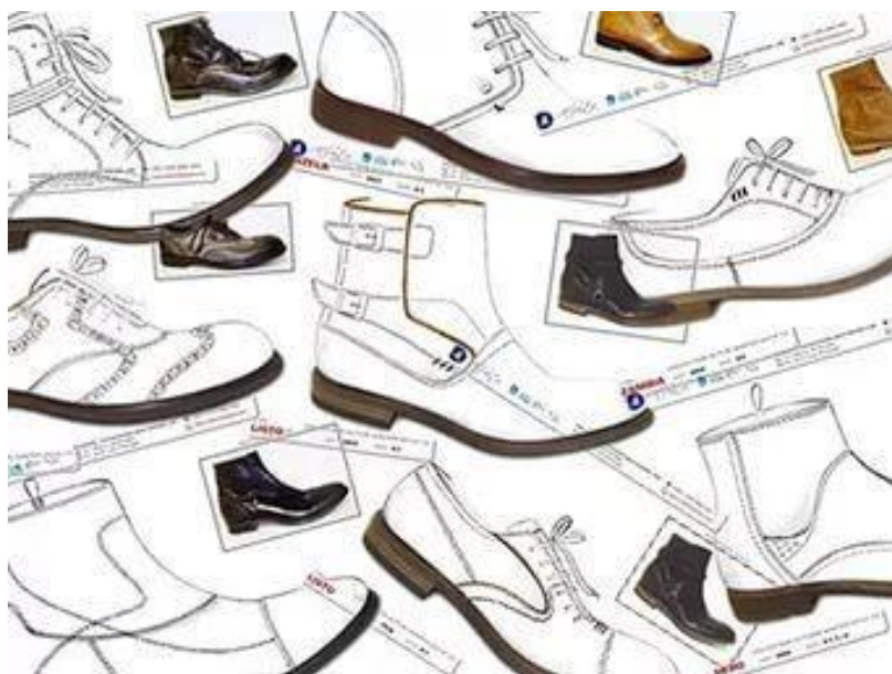
Рис.3 Образец композиции обуви на листе

Аксессуары помогают придать нужное настроение комплекту. Ремень по-прежнему занимает главенствующую позицию в мужской аксессуарной группе. Он должен быть четкой, достаточно строгой формы. При выборе цвета лучше ограничиться оттенками черного, коричневого. Очень интересны ремни, у которых переворачивается пряжка. С одной стороны он черный, а с другой, к примеру, коричневый, это очень удобно для поездок.