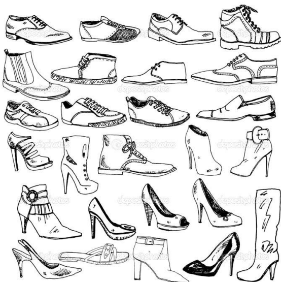
Рис.16 Различные формы обуви