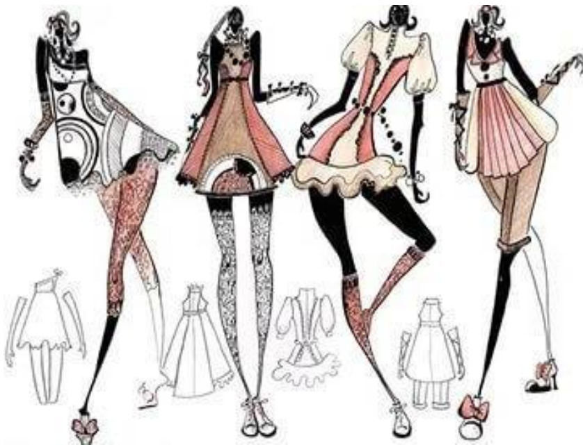
Рис.6 Композиция, при которой центром композиции является оформление ног

Задачи: умение создавать эмоционально насыщенные композиции, которые лягут в основу работы с материалом, изучение традиционных и создание на их основе авторских технологий и способов художественной обработки материала, умение воплощать проектный замысел в изделиях при художественном проектировании костюма.