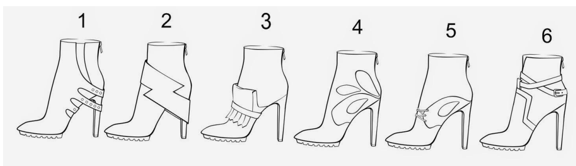
Рис.4 Образец оформления обуви

Аксессуары помогают придать нужное настроение комплекту. Ремень по-прежнему занимает главенствующую позицию в мужской аксессуарной группе. Он должен быть четкой, достаточно строгой формы. При выборе цвета лучше ограничиться оттенками черного, коричневого. Очень интересны ремни, у которых переворачивается пряжка. С одной стороны он черный, а с другой, к примеру, коричневый, это очень удобно для поездок.