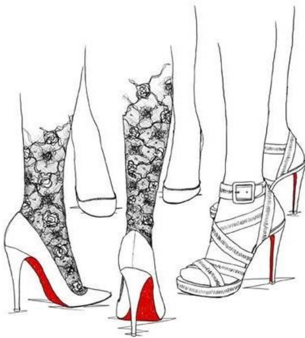
Рис.7 Излишний акцент на оформлении ног