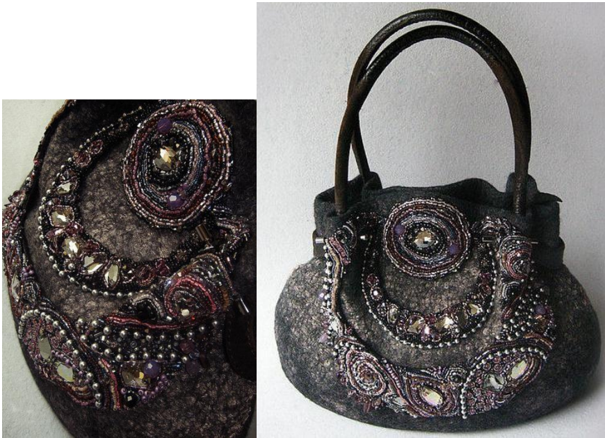
Рис.12 Изготовление аксессуаров по индивидуальному заданию