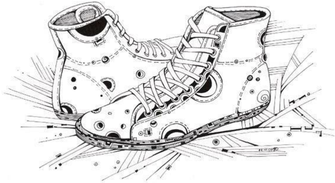
Рис. 5 Композиция на листе А3, выполненная в графике