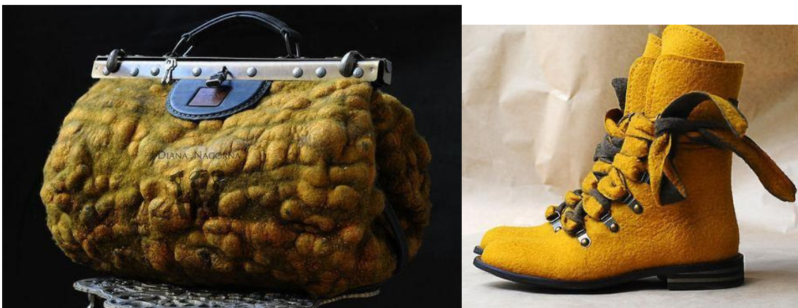
Рис.14 Изготовление аксессуаров по индивидуальному заданию