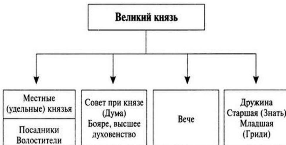
Рисунок 2 – Управление древнерусским государством

Текст текст текст текст текст текст текст текст текст текст текст текст текст.