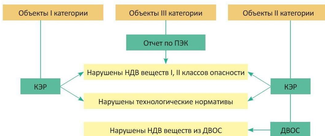
Рисунок 1 – Случаи исчисления вреда, причиненного атмосферному воздуху

Для юридических лиц и индивидуальных предпринимателей, осуществляющих деятельность на объектах I и II категорий, предельно допустимые выбросы признаются соответственно НДВ, технологическими нормативами: