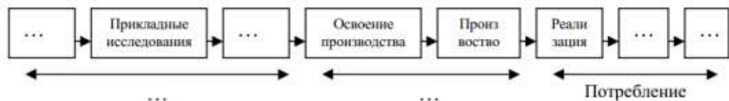
Рис. 1 Инновационная цепь

4. Заполните пропущенные стадии и их содержание в инновационной цепи (рис. 1).