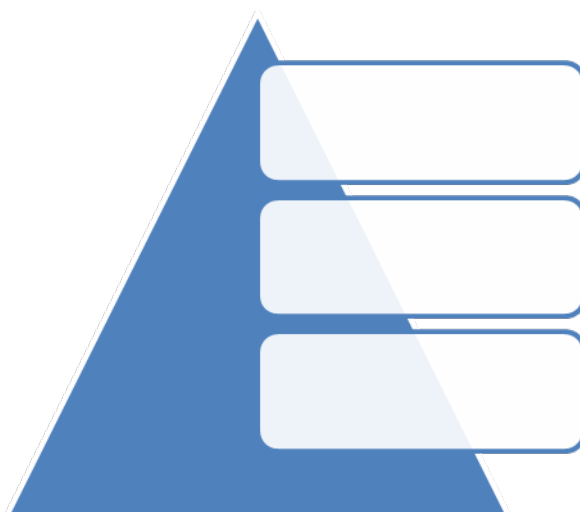
Рис.2. – Уровни управления в организации