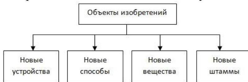
Рисунок 2.4 – Объекты изобретений

Автором изобретения признается человек (по юридической терминологии – физическое лицо), творческим трудом которого оно было создано. Если же объект промышленной собственности создавался совместно несколькими лицами, то все они считаются равноправными авторами. В этом случае порядок пользования правами авторов определяется соглашением между ними.