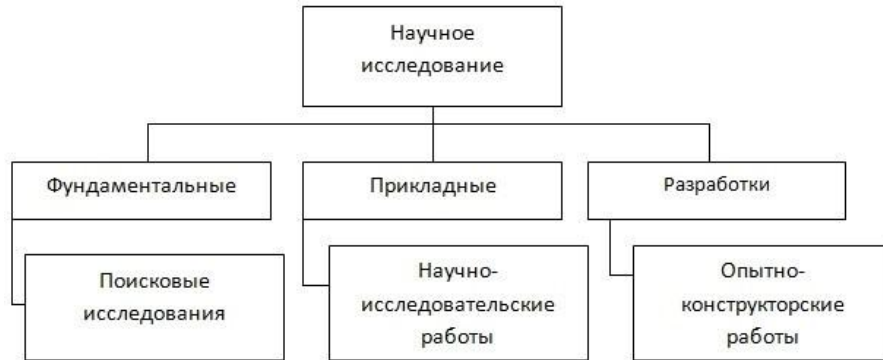
Рисунок 1.3 – Классификация научного исследования по целевому назначению