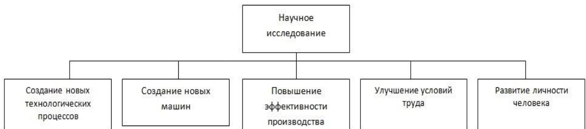
Рисунок 1.4 – Классификация научного исследования по видам связи с общественным производством

Поисковыми называют научные исследования, направленные на определение перспективности работы над темой, отыскание путей решения научных задач.