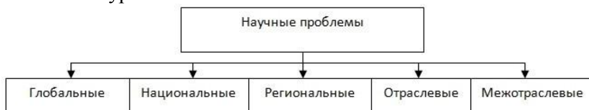
Рисунок 1.7 – структура научной проблемы

- разработку и создание новых лекарственных средств, препаратов, методов лечения и диагностики, что, в свою очередь, приведет к снижению уровня заболеваемости.