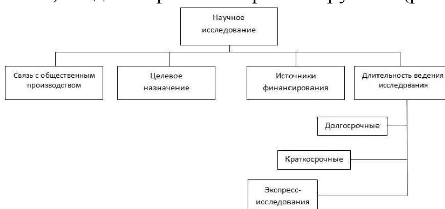
Рисунок. 1.1 – Классификация научного исследования

По источнику финансирования различают научные исследования бюджетные, хоздоговорные и нефинансируемые (рис. 1.2).