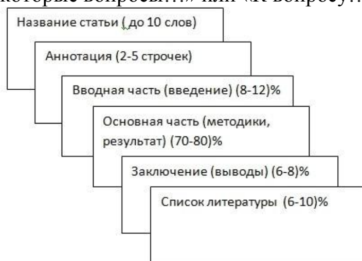
Рисунок 2.1 – Структура научной публикации

Название статьи должно быть конкретным и точно определять ее содержание, в то же время быть привлекательным и броским. Ведь по названию статьи судят о содержании. Это особенно важно сейчас в связи с огромным потоком информации. Точное название поможет статье найти читателя, неточное или неопределенное – привести к тому, что она окажется не замеченной специалистами. Название должно быть по возможности кратким – не более восьми – десяти слов. Не следует включать в название такие формальные и неопределенные слова, как «Исследование...» или «Изучение...», «Некоторые вопросы...» или «К вопросу...».