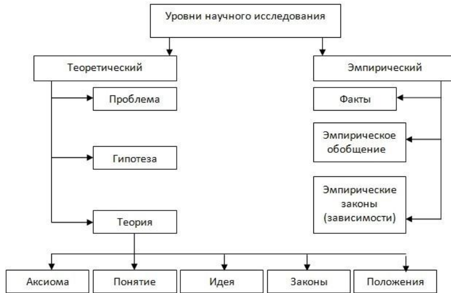
Рисунок 1.5 – Уровни научного исследования

Теоретический уровень исследования характеризуется преобладанием логических методов познания. На этом уровне полученные факты исследуются, обрабатываются с помощью логических понятий, умозаключений, законов и других форм мышления.