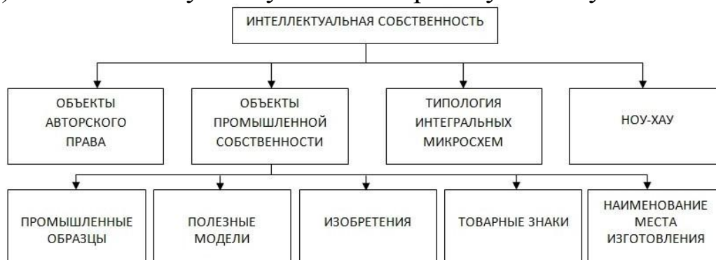
Рисунок 2.2 – Группы интеллектуальной собственности

Под ноу-хау (английское know how – знать, как сделать, уметь) понимают служебную и коммерческую тайну.