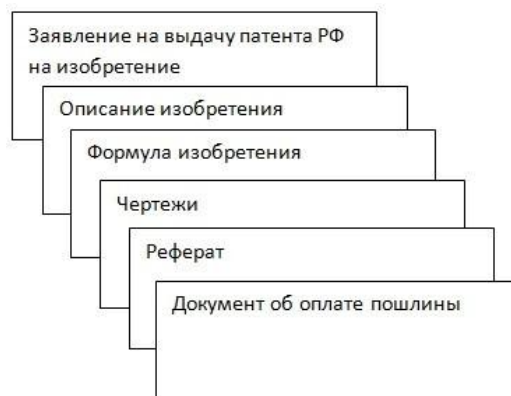
Рисунок 2.5 – Комплект документов

Формула изобретения состоит из двух частей: ограничительной и отличительной.