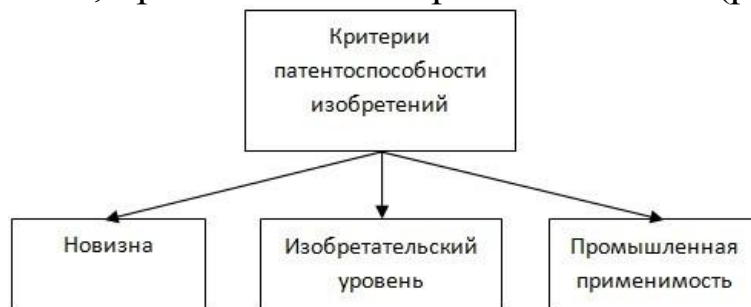
Рисунок 2.3 – Критерии патентоспособности изобретений

Изобретение – это решение технической задачи. Согласно Гражданскому закону Российской Федерации изобретению предоставляется правовая охрана, если оно обладает новизной, изобретательским уровнем, промышленной применимостью (рис. 2.3).