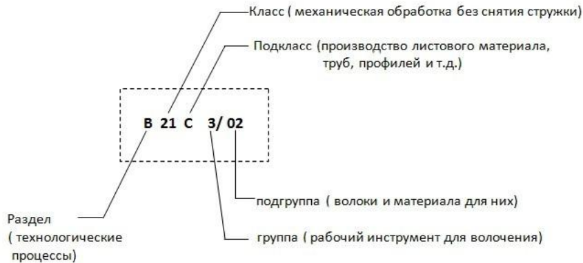
Рисунок 2.6 – Индекс МПК

F- механика, двигатели, освещение, отопление; G – физика; H – электричество.