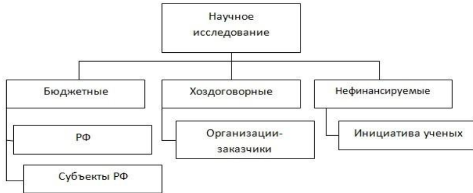
Рисунок 1.2 – Источники финансирования

В нормативных правовых актах о науке научные исследования делят по целевому назначению на фундаментальные, прикладные, поисковые и разработки (рис. 1.3).