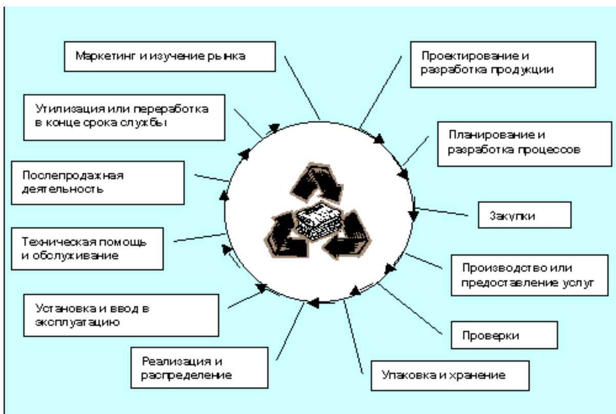
Рисунок 1 – Жизненный цикл продукции

При разработке процессной модели предприятия за основу принимаются процессы жизненного цикла продукции, представленного на рисунке 1.