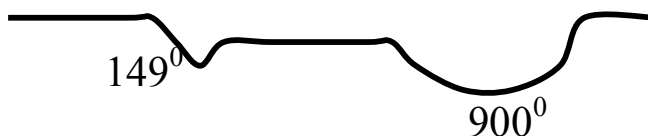
Рисунок 2 - Кривая ДТА известняка

Рассмотрим кривую дифференциально-термического анализа (ДТА) известняка (рисунок 2):