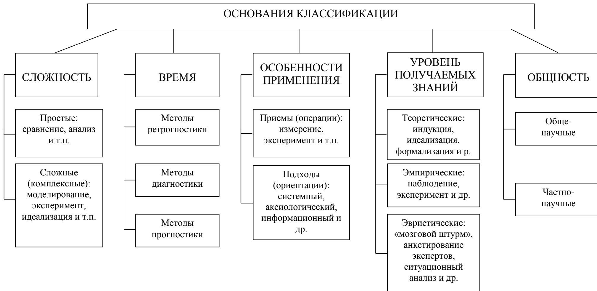
Рисунок 2 – Классификация методов научного познания