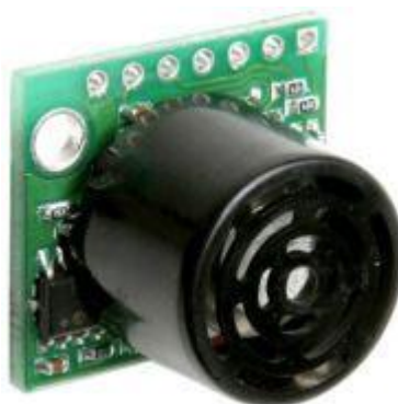
Рисунок 3 Датчик LV-MaxSonar -EZ1 High Performance Sonar Range Finder

На рисунке 3 показан датчик LV-MaxSonar -EZ1 High Performance Sonar Range Finder. Характеристики датчика приведены в таблице 3.