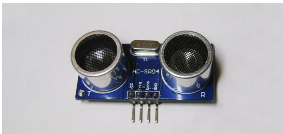
Рисунок 1 Датчик HC-SR04

Приведем некоторые модели ультразвуковых дальномеров, которые могут быть использованы в мобильной робототехнике. На рисунке 1 показан датчик HC-SR04. Характеристики датчика приведены в таблице 1.