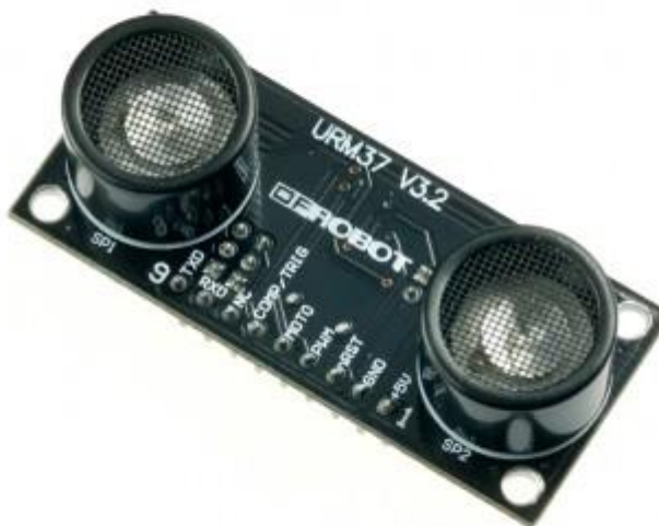
Рисунок 3 Датчик URM37 V3.2

На рисунке 4 показан датчик URM37 V3.2. Характеристики датчика приведены в таблице 4.