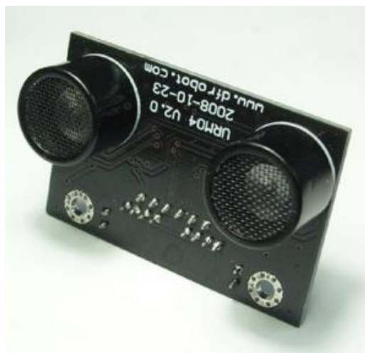
Рисунок 2 Датчик URM04 V2.0