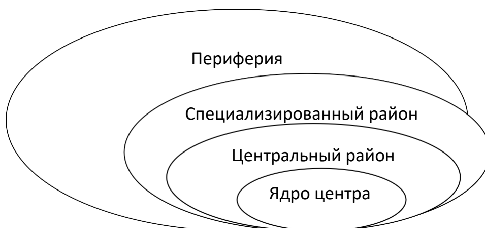
Рисунок 1 - Зональные сферы современного города