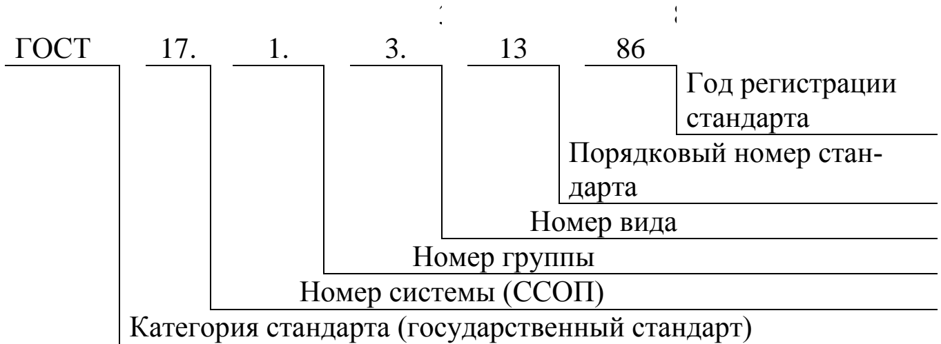
Рисунок 2 – Структура обозначения государственных стандартов системы стандартов охраны природы

Пример: ГОСТ 17.1.3.13–86 «Охрана природы. Гидросфера. Общие требования к охране поверхностных вод от загрязнения»: