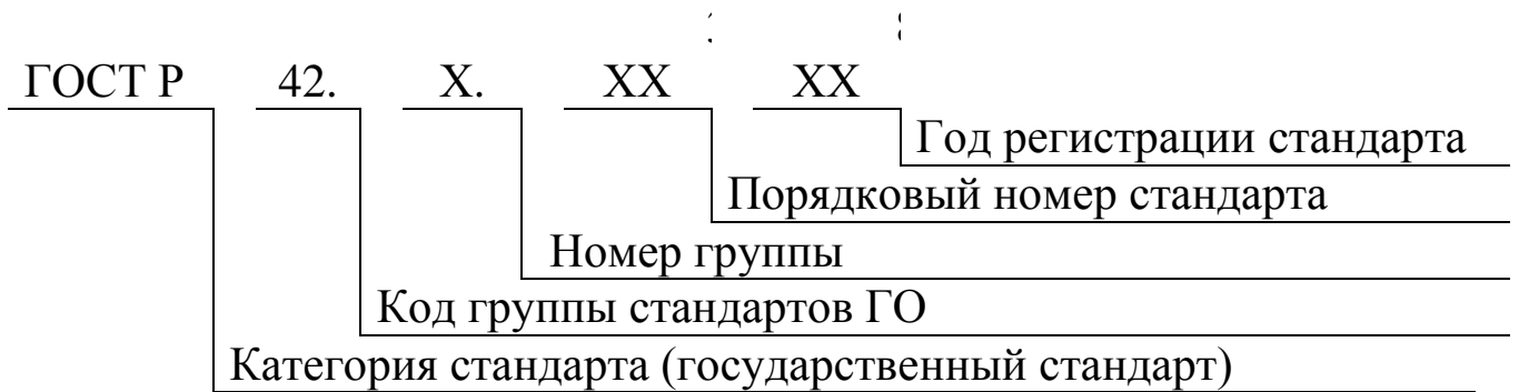
Рисунок 3 – Структура обозначения государственных стандартов системы стандартов ГО

Стандарты группы «0» устанавливают: основные положения комплекса стандартов ГО; термины и определения основных понятий ГО, а также их сокращения и обозначения; требования, нормы и правила по обеспечению готовности сил и средств ГО; методы оценки и прогнозирования последствий применения современных средств поражения.