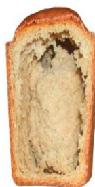
Картофельная болезнь хлеба

Компетентностно-ориентированная задача № 8 Определите, какие дефекты хлебобулочных изделий могут возникнуть, если: