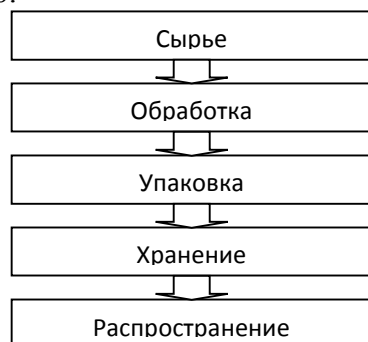
Рис. 1. Образец блок-схемы