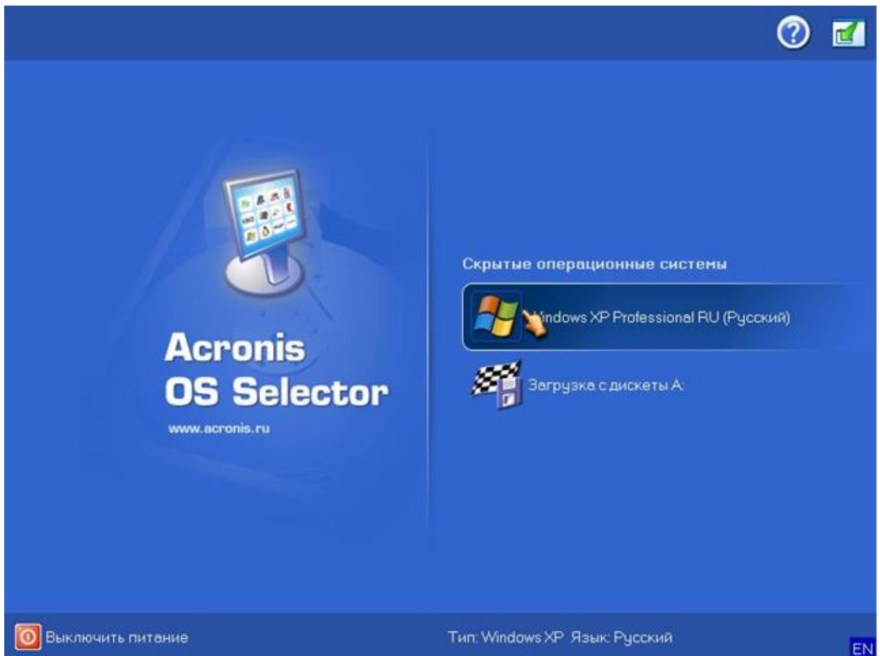
Рис. 3 - Acronis OS Selector

Эта утилита позволяет установить несколько операционных систем на компьютер под управлением Windows XP или более новой версии (включая Windows 7). Загрузка операционной системы может выполняться с любого раздела на любом диске, либо вы можете разместить несколько ОС в одном разделе. Этот инструмент легко использовать и он работает очень быстро.