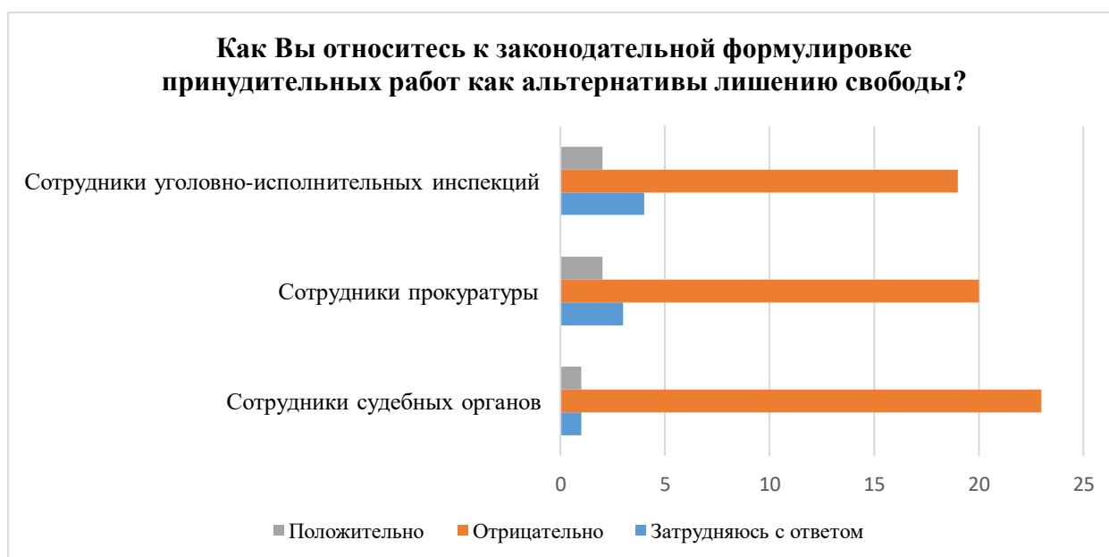
Рисунок 1. Результаты интервьюирования сотрудников правоприменительных органов Курской области.

В обозначенный период было проведено стандартизированное интервьюирование в формате индивидуальных и коллективных бесед с 75 практическими работниками (из судов и прокуратур г. Курска и Курской области).