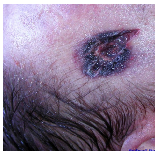
Выстрел в упор из пистолета ПМ