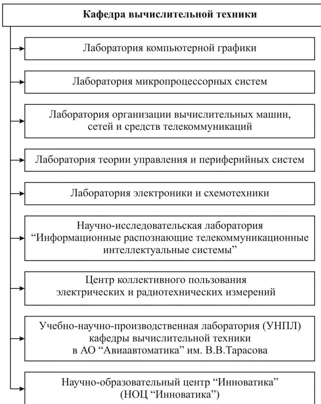
Схема организационной структуры кафедры ВТ