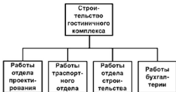
г) Организационный подход