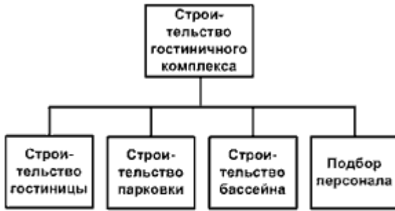
а) Продуктовый подход