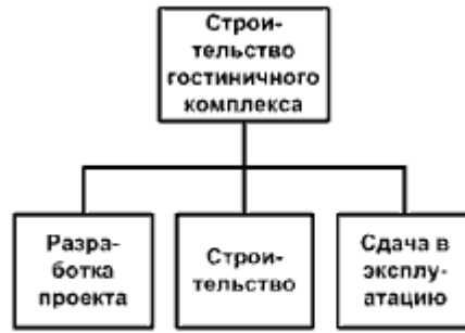
б) Подход по жизненному циклу