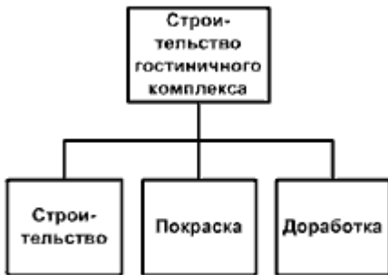
в) Функциональный подход