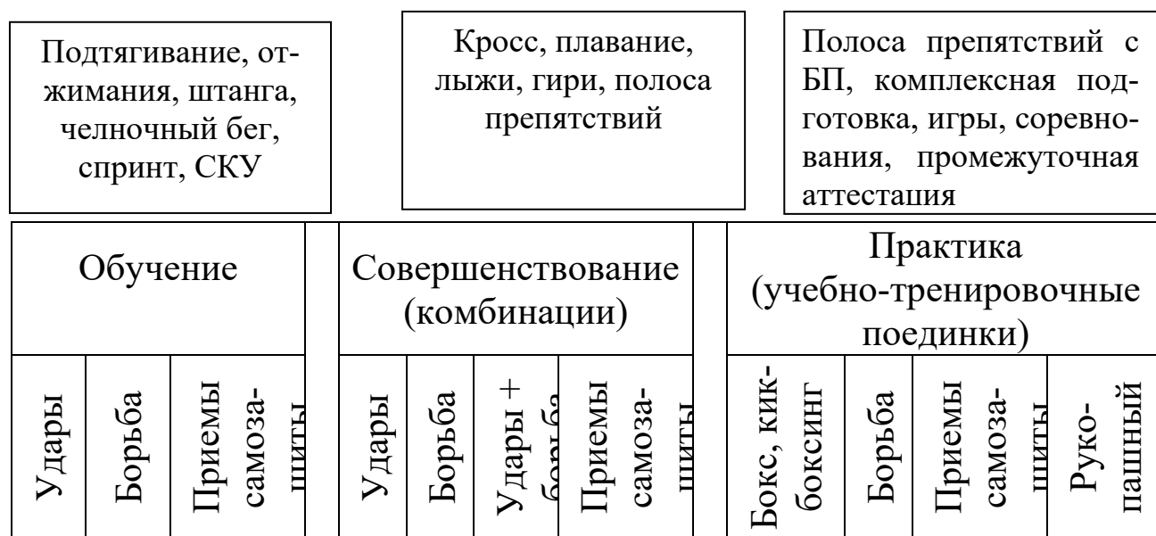
Рис. 1 Схема организации обучения

Основными видом аудиторной работы студентов при обучении являются практические занятия. На них излагаются и разъясняются основные понятия, теоретические и практические проблемы, разучивается и совершенствуется техника выполнения приемов единоборств и физические качества обучающихся, даются рекомендации для самостоятельной работы. Качество учебной работы студентов преподаватель оценивает по результатам тестирования.