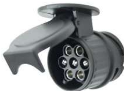
Рис. 9 Розетка для подключения приборов прицепа

Для быстрого подключения электрооборудования прицепа к бортовой сети автомобиля используются специальные розетки и «вилки». Существует два вида розеток: 7-ми и 13-ти контактные. Основная масса всего спецавтотранспорта (прицепы, полуприцепы и т.п.) оснащена розетками с 7-ю контактами (рис. 9), однако 13-ти контактная схема подключения являются более прогрессивным вариантом и в большей степени отвечает требованиям современных автомобилей и прицепов.