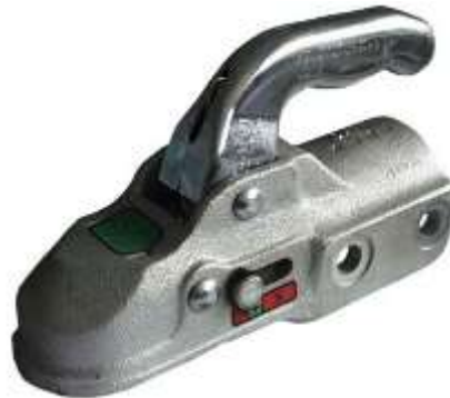
Рис. 8 Сцепная головка прицепа

Элементы сцепных головок прицепов отечественного производства так же, как и элементы ШТСУ, стандартизованы, что дает возможность с одним типом сцепного устройства автомобиля использовать прицепы различных производителей.