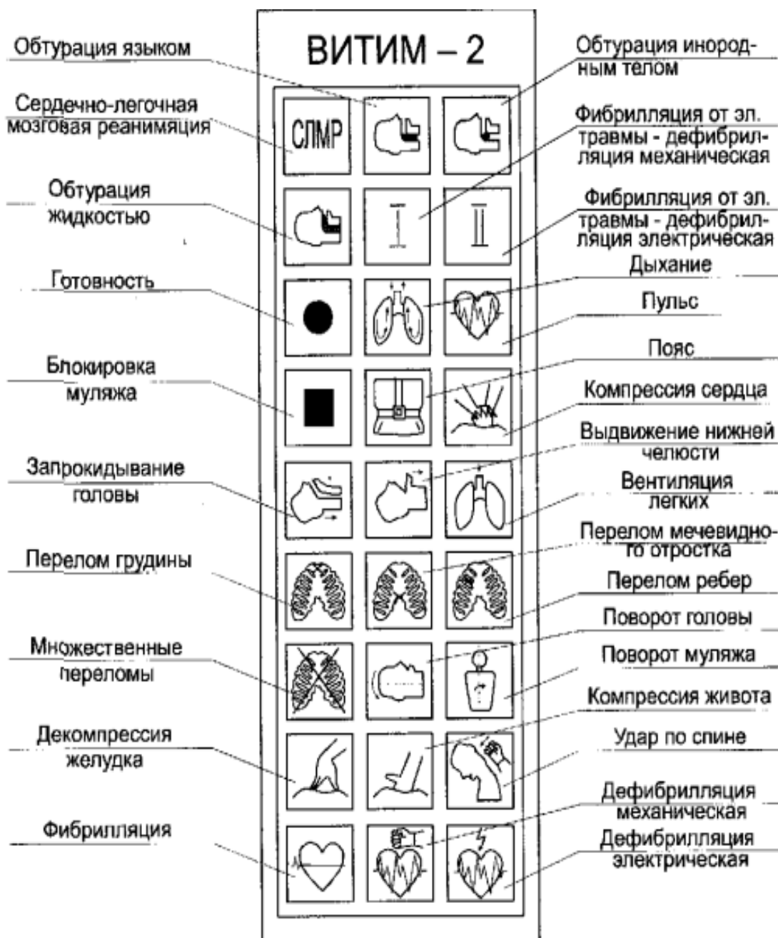
Рис. 2 Функциональные смысловые назначения криптограмм пульта управления

3.1.1. Нажать на пульта управления кнопку «СЛМР», при этом на дисплее имитируется работающее сердце, артериальный кровоток, работающие легкие, кора головного мозга розовая, включена индикация поясного ремня. На индикаторе времени показания «00» (не изменяются). Через 15 с. включается кратковременный звуковой сигнал, на ин-