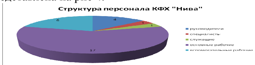
Рисунок 4 – Структура производственно-промышленного персонала КФХ «Нива»

Количество людей, подотчетных одному менеджеру, соответствует норме управляемости, хотя незначительные отклонения имеются. Таким образом, соблюдено требование рационального числа подчиненных у каждого руководителя. Численность работников представлена на рис 4.