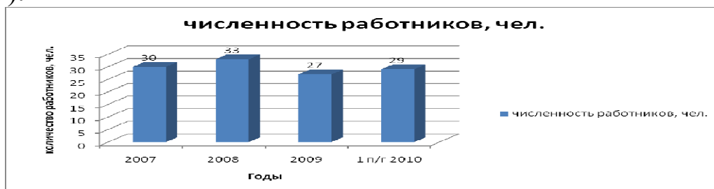
Рисунок 5 – Численность персонала КФХ «Нива»

Численность персонала по годам представлена на графике (рис.5).