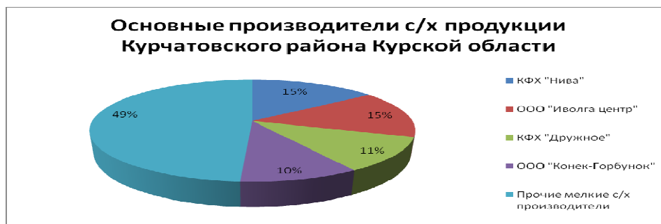
Рисунок 3 – Рынок с/х продукции Курчатовского района Курской области